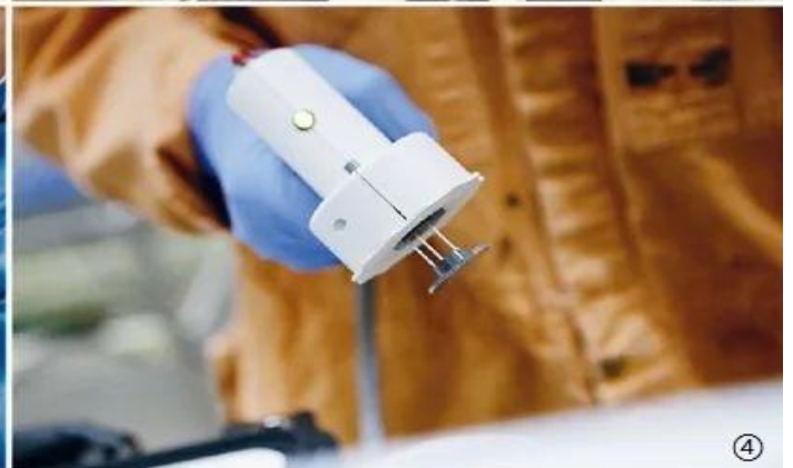
图 1：中国工作人员在演示新冠病毒 mRNA 疫苗实验过程；